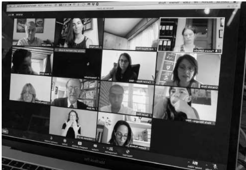
Imágenes de la plataforma Zoom, a la que se conectaron expositores y panelistas para realizar la transmisión.